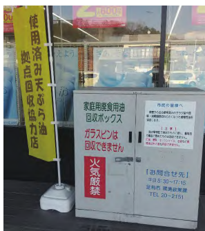
▲店舗に設置された 廃食用油回収BOX

環境問題は私たち全員に関係する大切なことで、みんなで取り組むことが求められています。各種事業へのご理解とご協力をお願いいたします。