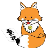
不動産登記推進 イメージキャラクター 『トウキツネ』