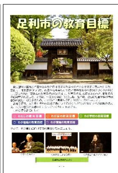
左:「足利市の教育目標」冊子(全135ページ)