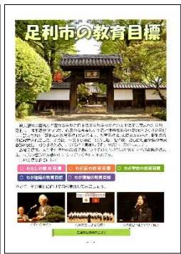
左:「足利市の教育目標」冊子(全135ページ)