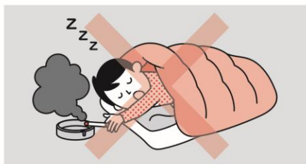
①寝たばこは絶対にしない、させない