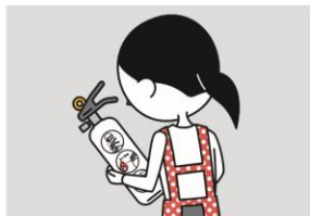
④火災を小さいうちに消すために、消火器等を設置し、使い方を確認しておく