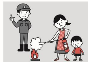
⑥防火防災訓練への参加、戸別訪問などにより、地域ぐるみの防火対策を行う