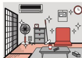
③火災の拡大を防ぐために、部屋を整理整頓し、寝具、衣類及びカーテンは、防火用品を使用する