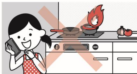
③こんろを使うときは火のそばを離れない