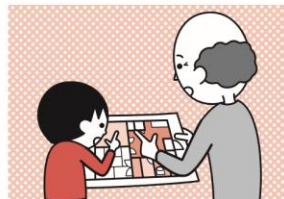
⑤お年寄りや身体の不自由な人は、避難経路と避難方法を常に確保し、備えておく