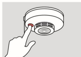
②火災の早期発見のために、住宅用火災警報器を定期的に点検し、10年を目安に交換する