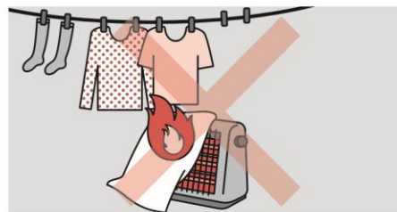
②ストーブの周りに燃えやすいものを置かない