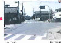
J/A足利 北郷支所前交差点 施行前