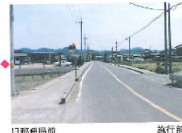
口郵便局前 施行前