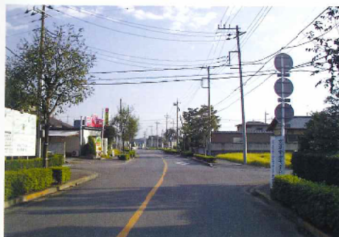
施行後 都市計画道路3-5-107号 大橋町赤松台二丁目線(市道体育館通り)