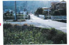
市道北郷学校通り 榎岸橋方向 施行前