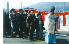
孫子三代渡り初め