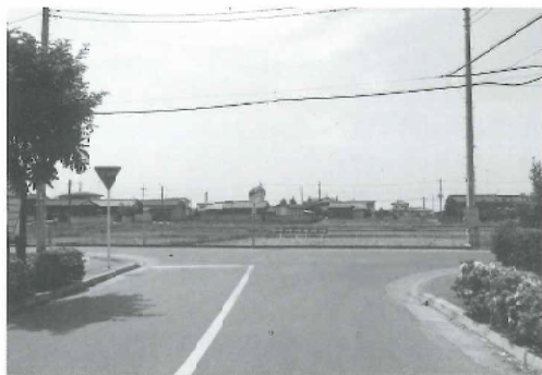
施行前 赤松台住宅団地より地区内を望む