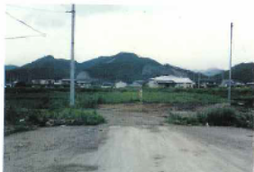
市道体育館通り 茅島橋方向 施行前