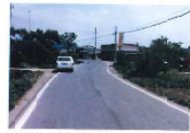
伊豆松田・大月線 施行前