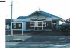
利保町警察官駐在所