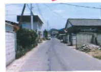
市道利保町21号線 茂内科方向 施行前