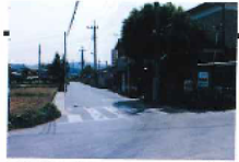
三辻南北T字路 施行前