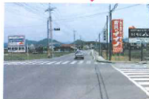
伊豆湯飛駒・足利線 施行前