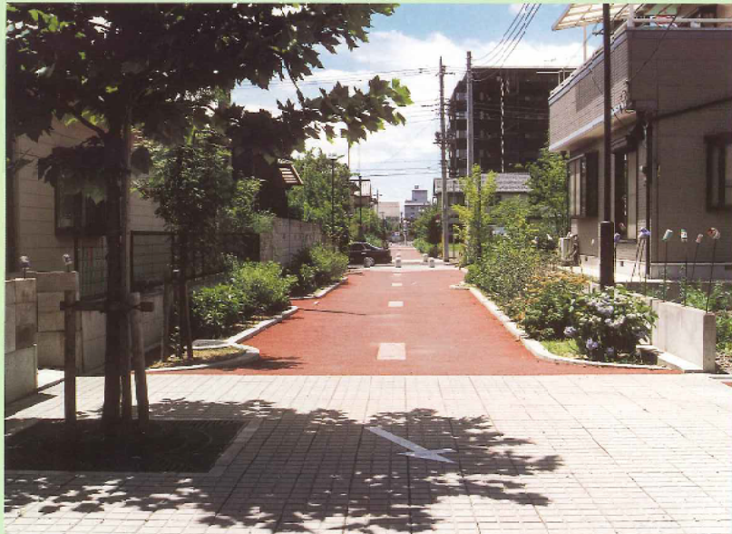
完成した歩行者専用道路

一、足利市は伸びゆくまちです。しごとを愛し、みんなの創意で時代の進歩に調和した活気のあるまちをつくりましょう。