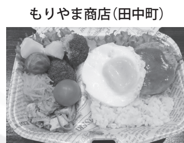
もりやま商店(田中町)