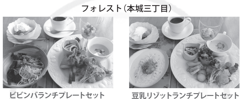
フォレスト(本城三丁目)