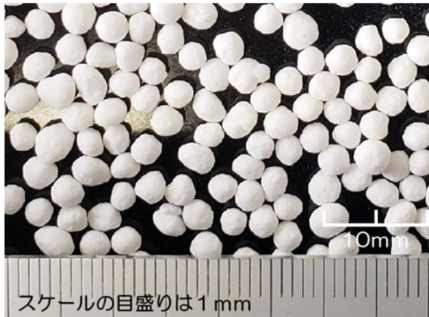
プラスチックを活用した被覆肥料