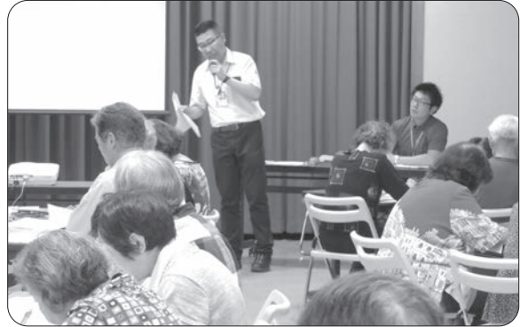
↑ 富田公民館での出前講座の様子

令和元年5月31日および7月3日に、葉鹿公民館・富田公民館で人権と男女共同参画に関する「出前講座」を開催しました。公民館からの依頼で講師として市職員が出向き、講座に参加された2公民館で延べ80名の市民の方々に對して、人権と男女共同参画の2つのテーマについて合計2時間ほどのグループワークを行いました。