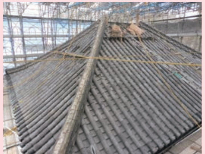
大成殿保存修理工事(大棟解体状況)