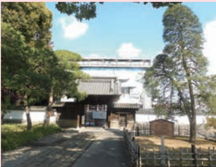
大成殿保存修理工事(外観)