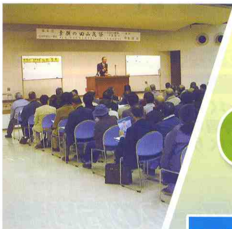
平成19年2月17日に館林市で開催されたリレー講座の様子

足利市のA、佐野市のS、桐生市のK、太田市のO、館林市のTと、それぞれの市のアルファベットから頭文字をつないで創った造語です。