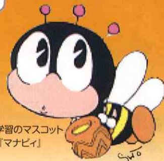
生涯学習のマスコット 「マナビ」