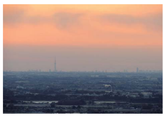
天狗山山頂より東京スカイツリーを望む