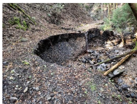
仙人ヶ岳コース欠落箇所