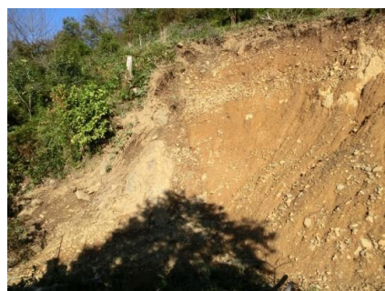
土砂災害箇所(樺崎町)