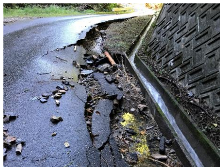
林道被害(名草上町)