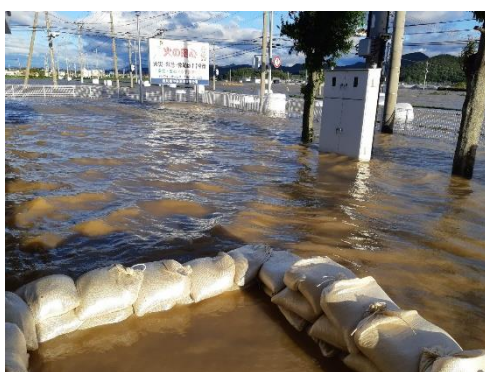
川崎町 東分署北側駐車場