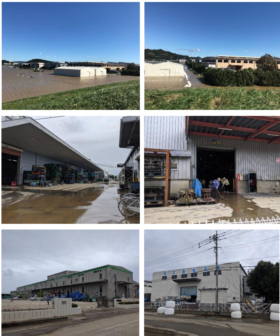
川崎町 毛野東部工業団地