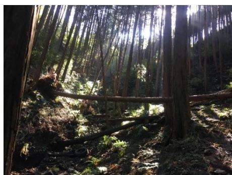
石尊山・深高山コース倒木