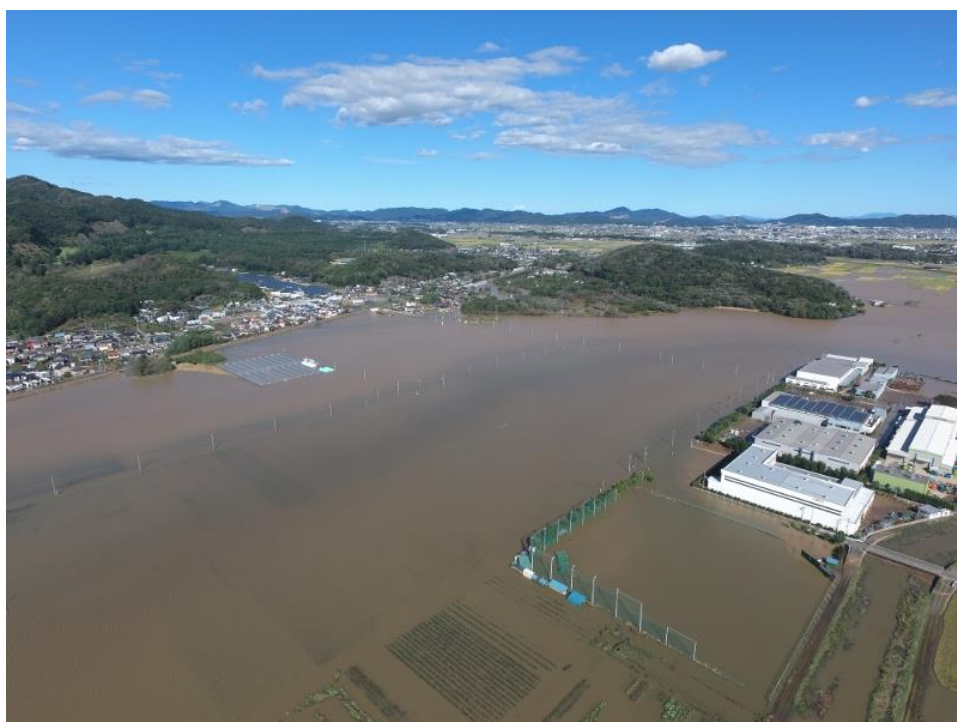
10月13日昼頃の毛野地区(大久保町、川崎町)の様子