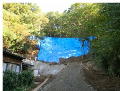
土砂災害箇所(助戸大橋町)