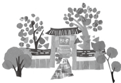
足利学校 門前マルシェ

〓 4月6日(水) / 午前10時〜午後3時 場 市役所市民ホール(本庁舎1階) 凶 栃木県不動産鑑定士協会による不動産(土地・建物)の価格、地代・家賃、借地権の価格などの無料相談 相 不動産鑑定士 申 事前申し込み不要