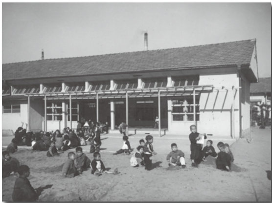
▲昭和26年ごろ。本市で最初に開所した大町保育所

所』と『生徒たちが人文字を描く小俣中学校』の写真をご紹介します。当時の子どもたちのいきいきとした姿が写し出されています。