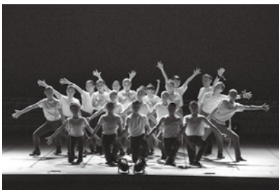
▲前年度公演の様子

時 3月1日(日)／午後2時 場 市民会館大ホール1階指定エリア(内) ジャズダンス、タップダンス、日舞、歌などの成果発表料[全席自由]500円※未就学児無料。申前売り券は市民会館、市民プラザで販売中