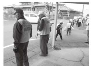
葉鹿地区 子どもの見守り