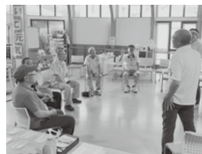
北郷地区 男の元気アップ教室