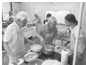
西校地区 男の料理教室