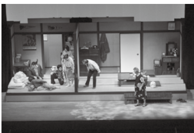
▲前年度公演の様子

シニア劇団『燦 SAN』定期公演 『時の物置』 時▷3月14日(土)=午後2時▷15日(日)=午後2時場市民プラザ文化ホール内懐かしい時代をお届けする永井 愛の昭和三部作▷作=永井 愛▷演出=加納朋之(文学座)▷制作=佐藤尚子(青年劇場)料[全席自由]▷一般=1,000円▷高校生以下=500円申前売り券は市民プラザ、市民会館で販売中※未就学児の入場不可。託児サービスあり(1歳以上・500円・3月7日(土)締切)。