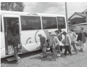
富田地区 買い物ツアー