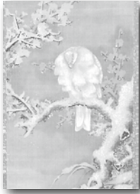
▲草雲筆『三白図』(部分) 慶応2(1866)年

時 1月25日(土)～3月22日(日)／午前9時～午後4時(内)冬にちなんだ花鳥や山水を中心に展示料220円※中学生以下無料。20人以上の団体は170円。