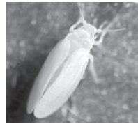
タバココナジラミ 体長 1.2mm 黄色の体、白い翅

野菜や花などに寄生する虫(タバココナジラミ)が植物にウィルス病を媒介します。この虫は飛んで移動し、特にトマト、きゅうり、トルコギキョウにおいて被害が多く発生しています。