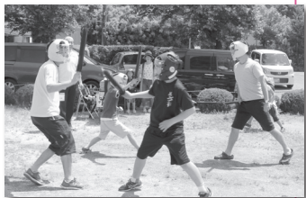
白熱のスポーツチャンバラ▲

表||吟詠剣詩舞、箏、オカリナ、 民謡民舞、フラダンス、コーラ ス、和太鼓、祭り囃子、八木節 出場者募集 青少年英語スピーチコンテスト 国際交流協会・☎2412 時6月16日(日)／午後1時場市民 会館小ホール内次のテーマに基 づいたスピーチによる総合審査 ▽英語スピーチ||『リンカーン のゲティスバーグ演説』(3分以 内)▽日本語スピーチ||『私と 「世界」がつながること』(2分以 内)※どちらも朗読可。定中学生