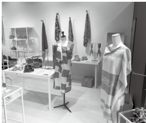
メンバー企業の意欲作が並ぶショールーム

ショールーム運営を通じて、実際に店舗を訪れたお客さんの声を聴きながら、商品の改良や新商品開発に取り組んでいます。