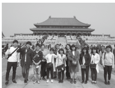
▲前回の訪中団の様子