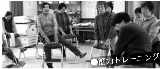
●筋力トレーニング