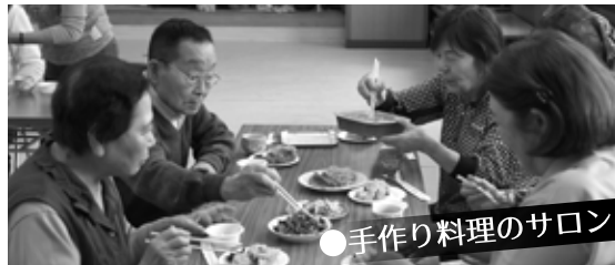
●手作り料理のサロン